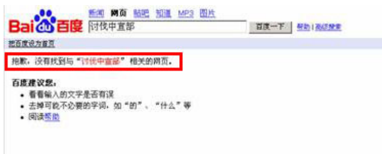
(图7、在百度搜索“讨伐中宣部”出现的却是“抱歉, 没有找到与‘讨伐中宣部’相关的网页”。)