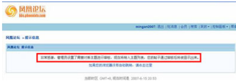
(图16、在凤凰论坛发布“九评共产党”的出现需要审核的系统提示。)

在凤凰论坛发布“九评共产党”的帖子，出现的是“非常感谢，管理员设置了需要对新主题进行审核，现在将转入主题列表，您的帖子通过审核后将被显示出来。”（见图16）