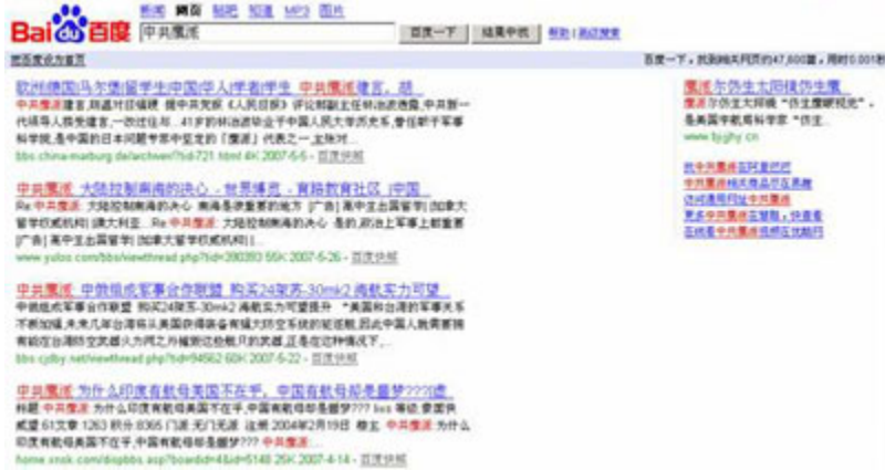
(图5、在百度正常搜索“中共鹰派”，结果显示47，600篇，用时0.001秒。)