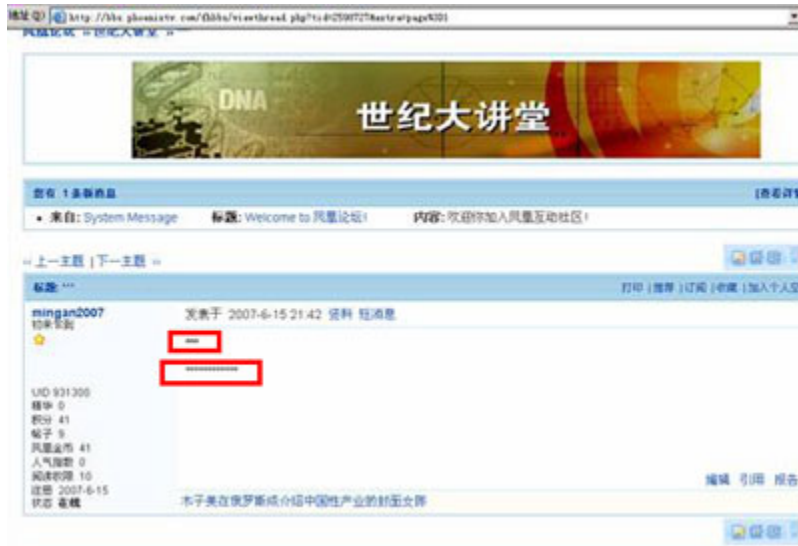
(图3、第一个红框：“中共鹰派”被替换为“***”；第二个红框：“中共鹰派中共鹰派中共鹰派中共鹰派”被替换为“*****”。)

在凤凰论坛发表含有“中共鹰派”四个词的帖子，帖子发表后在“中共鹰派”的地方就会出现“***”。（见图3）