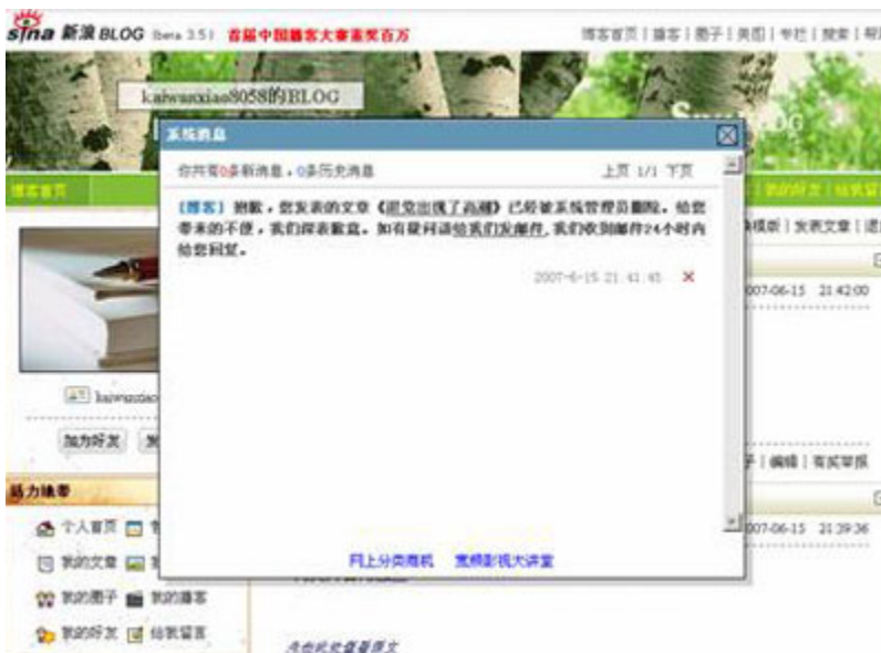
(图12、4分30秒后被删除，收到系统管理员发来的系统消息。)

4分30秒后被删除，收到管理员发来的系统消息：“抱歉，您发表的文章《退党出现了高潮》已被系统管理员删除，给你带来不便，我们深表歉意。如有疑问请给我们发邮件，我们收到邮件24小时内给您回复。”（见图12）