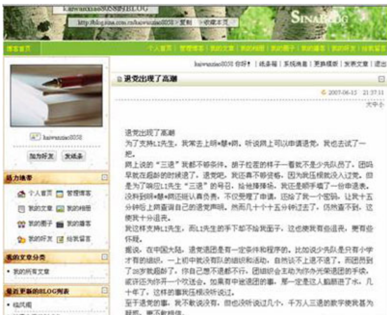
(图11、在新浪博客发表“退党出现了高潮”的文章，起初能正常显示。)

4分30秒后被删除，收到管理员发来的系统消息：“抱歉，您发表的文章《退党出现了高潮》已被系统管理员删除，给你带来不便，我们深表歉意。如有疑问请给我们发邮件，我们收到邮件24小时内给您回复。”（见图12）