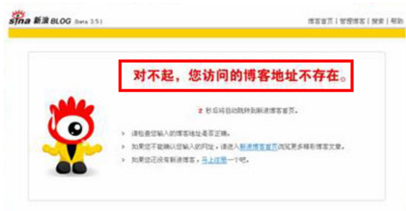
(图19、在新浪博客发表“九评共产党”后博客被封。)