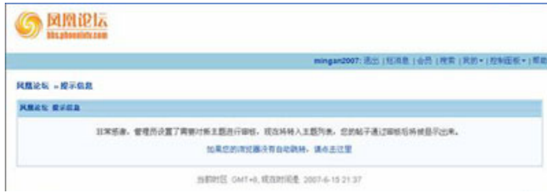
(图9、在凤凰论坛发表标题为“退党出现了高潮”的帖子后，视窗里显示“非常感谢，管理员设置了需要对新主题进行审核，现在将转入主题列表，您的帖子通过审核后将被显示出来。”)

在百度搜索“退党”后结果显示搜索到171,000篇，用时0.027秒。显示的第一条就是“退党出现了高潮”。点击此连接能正常打开。(见图10)