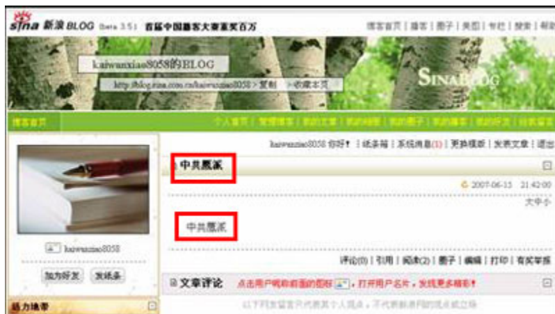
(图4、“中共鹰派”能在新浪博客正常发布)

而在“中共鹰派”这个屏蔽词在新浪博客发布、百度搜索时基本显示正常。（见图4、图5）