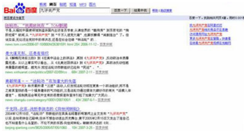
(图18、在百度搜索“九评共产党”后仅仅出现4篇相关网页。)