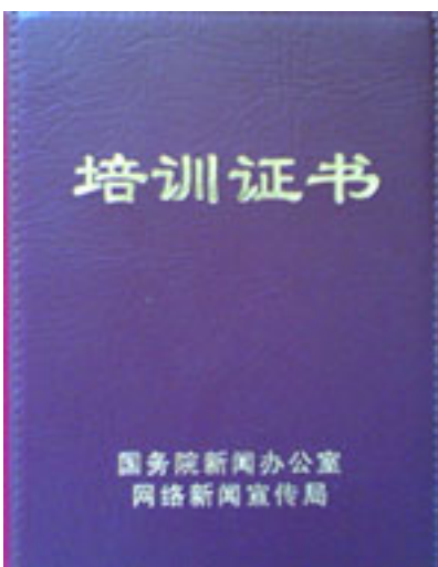
（图2、国务院新闻办公室网络新闻宣传局颁发的“互联网新闻业务培训证书”）

为了确保对网络媒体的控制，国务院新闻办采取的一招就是对网络从业人员进行思想灌输式的培训，使网络从业人员在以后工作中时时进行自我审查，不再发布敏感信息。并进行考试，合格者颁发“互联网新闻业务培训证书”（见图2）。这样的培训已进行了20多期，每期50人，每次培训时间5天左右。这类培训是对国家直接插手培训监控人员，利用互联网商务公司白领技术职业员工的自律和协助，来达到延伸政府监控网络的目的。