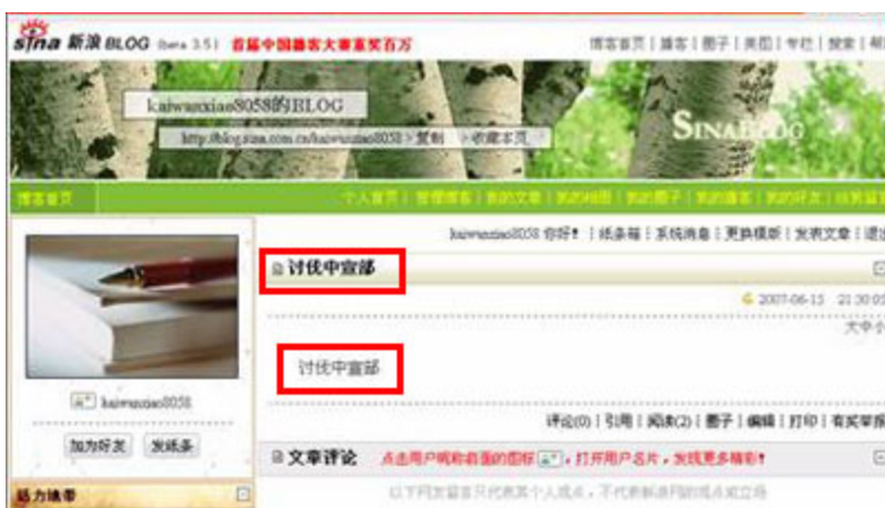
(图8、在新浪博客发布“讨伐中宣部”的博客文章能正常显示。)