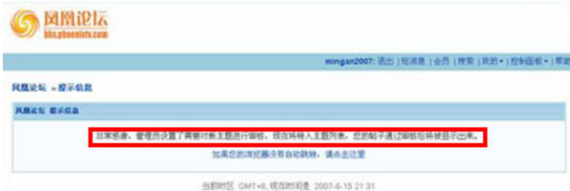
(图6、在凤凰论坛发布“讨伐中宣部”的帖子后显示“非常感谢，管理员设置了需要对新主题进行审核，现在将转入主题列表，您的帖子通过审核后将被显示出来。”) )

在凤凰论坛发布“讨伐中宣部”的帖子时，出现的却是“非常感谢，管理员设置了需要对新主题进行审核，现在将转入主题列表，您的帖子通过审核后将被显示出来。”（见图6）