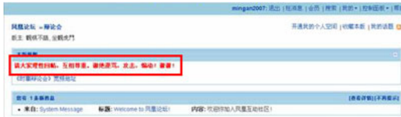
(图17、在凤凰论坛发布“九评共产党”的出现警告的系统提示。)