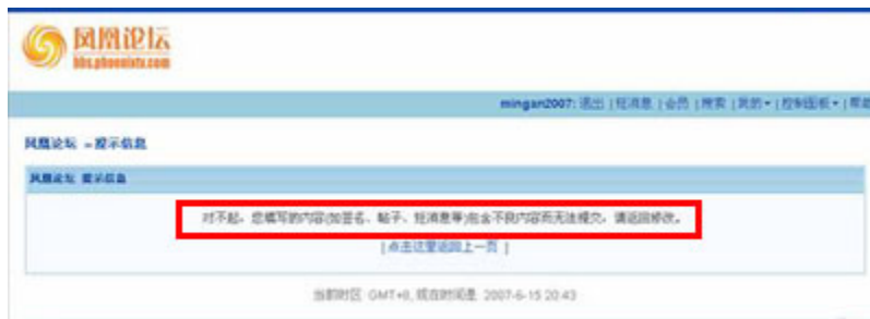
（图13、在凤凰论坛发布“六四十八周年了”的帖子后显示无法提交，需要修改。）

帖子发表后，视窗里出现：“对不起，您填写的内容（如签名、帖子、短消息等）包含不良内容而无法提交，请返回修改。”（见图13）