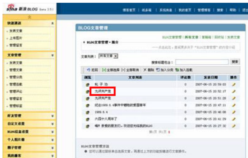
(图20、在新浪博客发表“九评共产党”后，文章在后台还存在。)