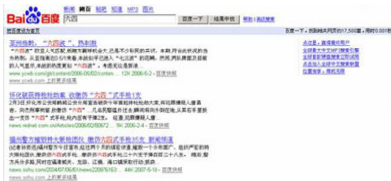
（图14、在百度搜索“六四”显示“找到相关网页17,500篇，用时0.001秒”。）

在百度搜索“六四”后，显示搜索结果为“找到相关网页17,500篇，用时0.001秒”。（见图14）