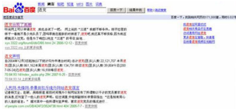
(图10、在百度搜索“退党”后结果显示搜索到171,000篇，用时0.027秒。)

在百度搜索“退党”后结果显示搜索到171,000篇，用时0.027秒。显示的第一条就是“退党出现了高潮”。点击此连接能正常打开。(见图10)