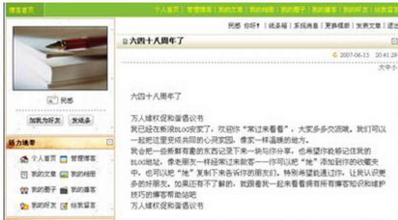
(图15、在新浪博客发表“六四十八周年了”能正常显示。)