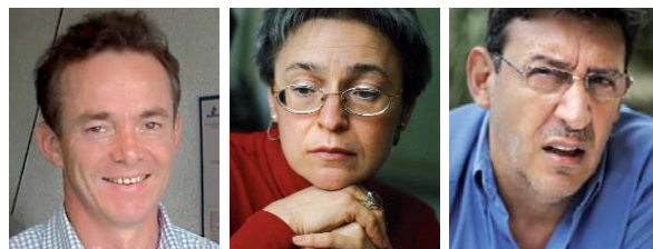
De gauche à droite : Jean Hélène, Anna Politkovskaïa et Christian Poveda

Jean Hélène à Abidjan en 2003, Anna Politkovskaïa à Moscou en 2007, Christian Poveda au Salvador, il y a quelques mois... Les Assises ont tenu à rendre hommage à ces trois journalistes assassinés dans l'exercice de leurs fonctions. Parce qu'ils gênaient un pouvoir politique ou mafieux.