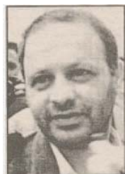
Le journaliste iranien Abkar Ganji, condamné à 6 ans de prison