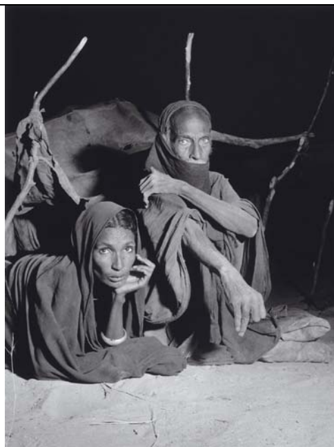
Les Touareg – Sud Saharien, 1951