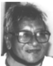
Le journaliste birman Win Tin, condamné à 20 ans de prison

L'album de photographies Jean-Philippe Charbonnier pour la liberté de la presse en vente partout à partir du 17 novembre prochain, présente les portraits de 15 journalistes actuellement emprisonnés.