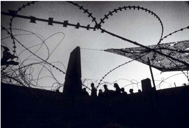
Des palestiniens franchissent les check points israéliens. Kalandia, Israël/Palestine, août 2002

Née à New York, Jane Evelyn Atwood vit à Paris depuis 1971. Travaillant d'abord dans la tradition de la photographie documentaire, elle est reconnue pour ses travaux en profondeur sur les prostituées à Paris, les légionnaires, les aveugles, le sida, les femmes en prison. Elle a été récompensée par les prix les plus prestigieux, dont le premier prix de la Fondation W. Eugene Smith, le Grand Prix Paris Match du photojournalisme, le prix Oskar Barnack et un prix Alfred Eisenstadt.