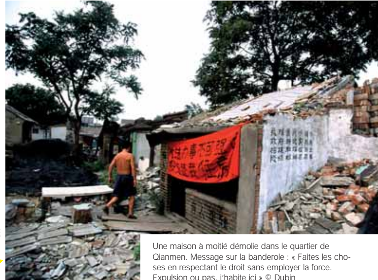
Une maison à moitié démolie dans le quartier de Qianmen. Message sur la banderole : « Faites les choses en respectant le droit sans employer la force. Expulsion ou pas, j'habite ici »

Ces expulsions ont lieu manu militari et l'insuffisance des dédommagements est à l'origine de conflits violents, durement réprimés. Les expulsions ont lieu également à la campagne pour faire place non seulement à des projets immobiliers mais aussi à des industries souvent polluantes. Ceux qui demandent justice pour les victimes d'expulsion font l'objet de poursuites, de harcèlement et d'incarcération.