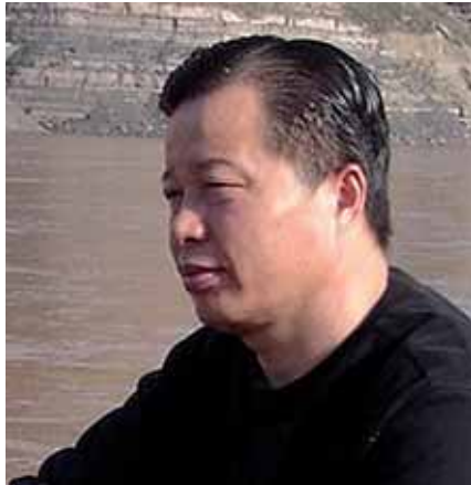
Gao Zhisheng, le difficile combat d'un avocat pour les droits humains, détenu pour avoir défendu la liberté d'expression et la liberté religieuse.

sont nommés et révoqués par la commission Politique et Juridique du Comité central du Parti communiste. De l'autre, les autorisations d'exercice pour les avocats sont données par les bureaux administratifs locaux. La profession d'avocat est actuellement considérée comme l'une des professions les plus dangereuses en Chine, après celles de policier et de journaliste. Outre les agressions physiques dont ils font l'objet, l'article 306 du Code pénal de 1997 fait peser sur eux la menace d'une accusation de faux témoignage. Si un avocat de la défense veut s'appuyer sur des témoignages qui contredisent les assertions du procureur, ce dernier peut se fonder sur cet article du Code pour demander l'arrestation de l'avocat pour faux témoignage. L'article 306 a entraîné l'emprisonnement de plus de 500 avocats.