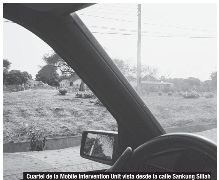
Cuartel de la Mobile Intervention Unit vista desde la calle Sankung Sillah

Pero los policías de guardia aquella noche, a un centenar de metros de allí, permanecieron extrañamente indiferentes a la ráfaga de disparos que restallaron en la calle Sankung Sillah. Según varias fuentes, el asesinato se produjo “poco después de las 22 horas”. Pero, incluso el jefe de la policía, Landing “13” Badjie, destituido después por estar implicado en un caso de corrupción, en el mes de diciembre aseguró al representante de Reporteros sin Fronteras que le habían avisado “después de media noche”.