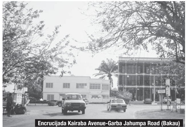
Encrucijada Kairaba Avenue-Garba Jahumpa Road (Bakau)