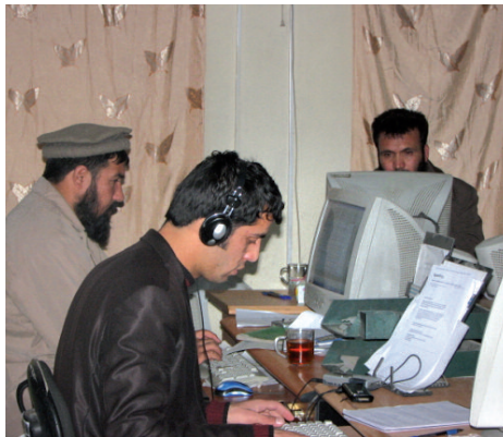
Journalistes afghans au travail