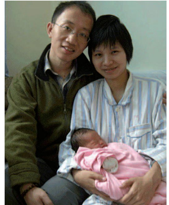
Hu Jia et Zeng Jinyan