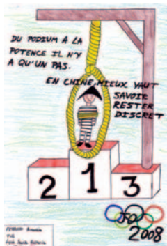
Dessin d'Amandine Ferrari.

Les 9 e Rencontres Internationales du dessin de presse (RIDEP) se sont tenues du 18 au 20 janvier à Carquefou, près de Nantes. Elles étaient centrées sur la Chine, à l'approche des Jeux olympiques de Pékin. Une délégation de six dessinateurs de presse chinois (le terme d'illustrateurs conviendrait mieux) était présente. Vite mal à l'aise devant l'évocation de la répression exercée par les autorités chinoises à l'égard de toutes les formes de contestation et leur refus de la liberté d'expression, elle s'est rapidement faite plus que discrète.