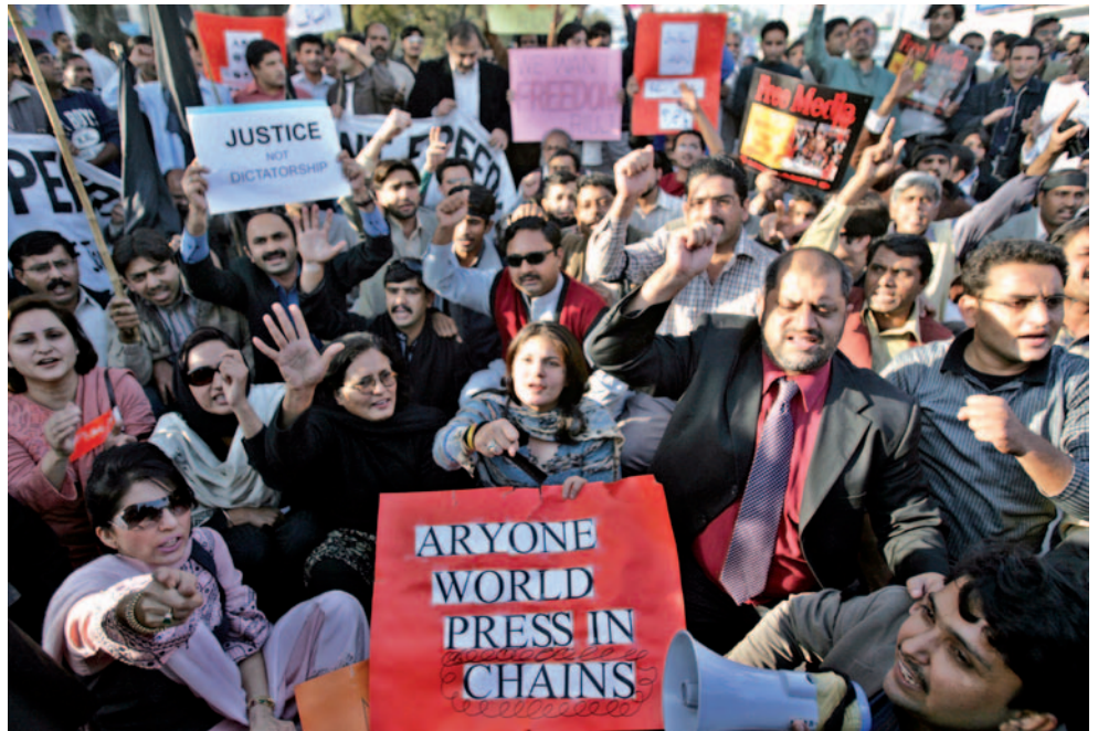
Islamabad, Pakistan : Des journalistes pakistanais manifestent contre le président Pervez Musharraf le 20 novembre 2007 pour demander le respect de la liberté de la presse.