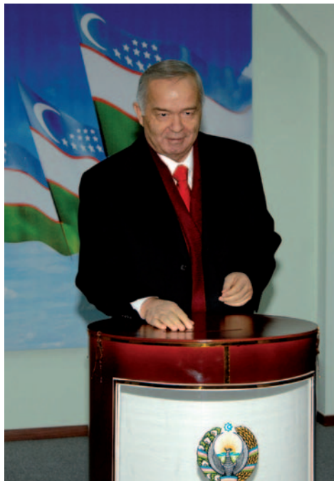
Tashkent, Ouzbékistan : Le président Islam Karimov en train de voter le 23 décembre 2007.

Les journalistes indépendants, qui travaillent pour des sites Internet basés à l'étranger ou pour la presse étrangère, ne sont guère mieux lotis. Ils ne sont qu'une vingtaine pour tout le pays, dont la moitié dans la capitale. Ils n'entretennent entre eux, le plus souvent, que des contacts virtuels. Ils sont qualifiés par le pouvoir de « traîtres qui vendent leur pays pour des dollars », de marionnettes « manipulées par des puissances étrangères jalouses des succès de l'Ouzbékistan ». Leurs difficultés, innombrables, vont de la tracasserie administrative à l'agression pure et simple, sans exclure la possibilité d'une arrestation. « Nous sommes tous des prisonniers politiques virtuels », conclut l'un d'entre eux.