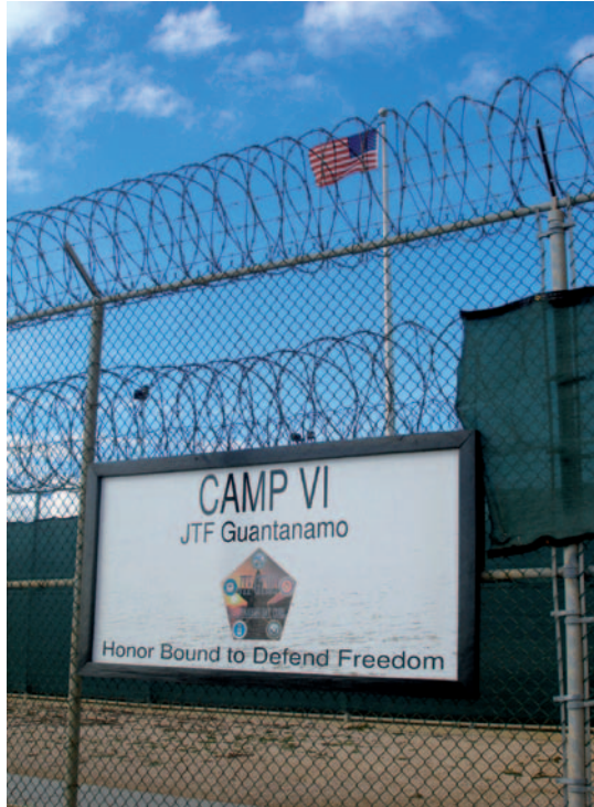
Entrée de l'un des centres de détentions de Guantanamo, le Camp VI.