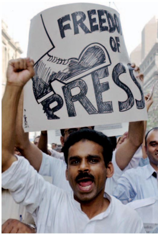
Karachi, Pakistan : Un journaliste pakistanais manifeste pour demander au gouvernement le respect de la liberté de la presse.