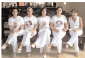
Dames en blanc

Epouses, mères et sœurs des "75", les Dames en blanc défilent chaque dimanche en sortant de la messe célébrée à l'église Santa Rita de La Havane. Récompensées en 2005, avec Reporters sans frontières, du prix Sakharov pour la liberté de l'esprit par le Parlement européen, elles subissent aussi toutes sortes de brimades. Dernière en date, trente "dames" ont été empêchées jusqu'au dernier moment d'entrer dans la cathédrale de La