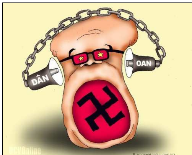
Babui – Danchimviet.com

Súng đã nổ, máu đã rơi, nhà tù đã mở cửa và thiên viện bị khóa cổng! Nhưng phải chăng đức vô úy (mà chư tăng Miền đã thủ đắc và truyền sang cho dân chúng) nay tan biến và con đường dẫn đến tự do đã đóng lại? Hẳn nhiên là không! Chẳng chế độ nào ngược với lòng dân mà tồn tại, và theo một câu nói ngàn xưa của dân Việt mang dạng sấm ngữ: "Giặc đến Bồ Đề thì giặc phải tan!" Như Đại Đức Giám Be Ya nói trong cuộc phỏng vấn ngày 28-09-2007: "Chúng tôi biết phía chính quyền có súng đạn và cũng như dân ở các nước khác, người dân Miền Điện sợ súng đạn vì súng đạn có thể bắn chết người. Nhưng xin đừng quên rằng ước mơ dân chủ, tự do, được sống thật với lương tâm của mình bao giờ cũng lớn hơn súng đạn, lớn hơn nỗi sợ hãi. Xưa nay, ai cũng bảo là "lương tâm thắng súng đạn" chứ đâu có ai nói "súng đạn thắng được lương tâm" bao giờ"! Cuộc đứng dậy của hai dân tộc Miền Việt sẽ dẫn đến tự do là điều chắc chắn! BAN BIÊN TẬP