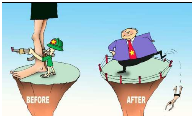
Lấy dân làm gốc (Babui – Danchimviet.com)