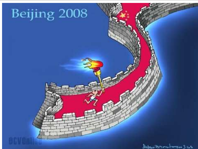
VN "mừng" Olympic (Babui – Danchimviet.com)