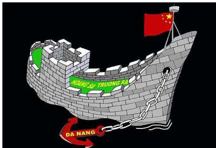
Tuần dương hạm Trịnh Hòa ghé Đà Nẵng (Babui - Dcvonline.net)

Đọc lại từ đầu đến cuối Tuyên ngôn Nhân quyền 1948 rồi nhìn lại Việt Nam từ hơn 60 năm qua, thật là cả một trời một vực. Không có điều khoản nào trong 30 điều khoản mà Cộng đảng VN (và mọi cộng đảng khác) lại không vi phạm ở một mức độ mà mọi chế độ bạo tàn tự cổ chí kim phải chào thua! BAN BIÊN TẬP