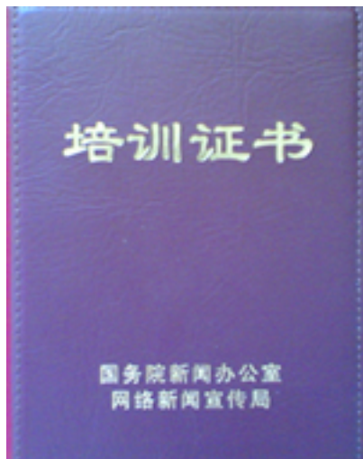
Certificado del cursillo de formación

Los ejecutivos de las sociedades digitales están sometidos a otro tipo de control ideológico. Desde 2004, y una vez al año, se organiza « un viaje de los medios digitales al país natal del comunismo ». A él, han sido invitadas las siguientes sociedades : Sohu, Sina, Netease, TOM, Zhonghua, Baidu, Beiqing, Zhongguo Sousuo, Xilu, Xici, Yahoo !, Hexun, Daqi, Qihu, Bokee, Soufang, Qianxiang Hudong y Kongzhong.