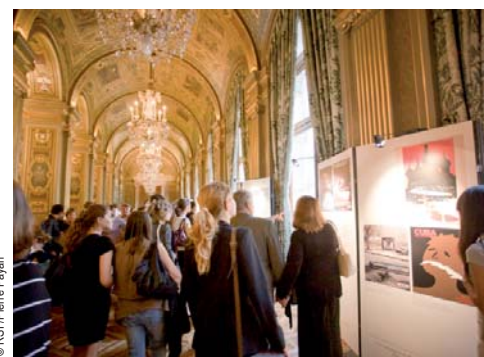
Les panneaux rappelant les campagnes de l'organisation ont eu du succès