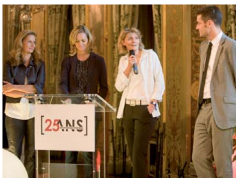
Le témoignage d'amitié de Florence Aubenas