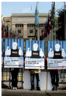
RSF manifeste à Genève