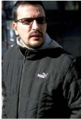
Socrates Guiliolas abattu à Athènes

Heureusement, l'Afrique incite un peu à l'optimisme. Un grand nombre de pays de ce continent gagnent des places, parfois de façon très significative, comme la Tanzanie qui se classe 41e (+21), le Tchad (+21), la Guinée-Bissau (+25), l'Angola (+15). Le Mali passe de la 30e place à la 26e où il rejoint le Ghana. La Namibie, en tête des pays africains au 21e rang, précède ces deux derniers de cinq places. Ces pays démontrent que l'on peut être pauvre et vertueux ! Le Nigéria hélas, l'État le plus peuplé d'Afrique, végète encore en 145e position. — D.J.