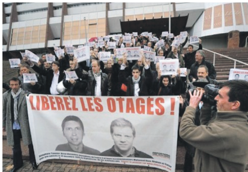
Les Assises ont manifesté pour la libération des otages