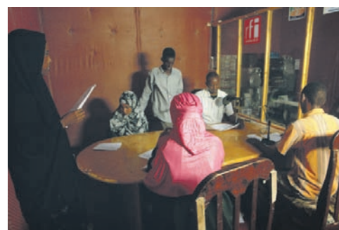
Des femmes participent à un débat en studio