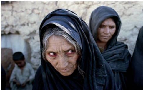
3. Une réfugiée afghane à Quetta au Pakistan. Février 2001.