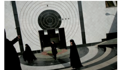
2. Centre d'entraînement au tir à l'académie de police des femmes à Téhéran, Iran, novembre 2004.