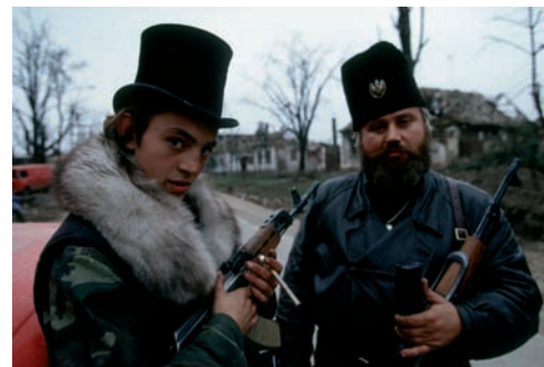
4. Des civils serbes armés après la chute de Vukovar. Croatie, novembre 1991.