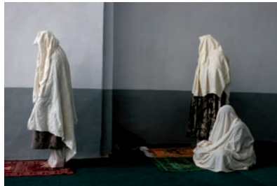
1. Femmes priant à la Grande Mosquée de Herat. Afghanistan, octobre 2004.