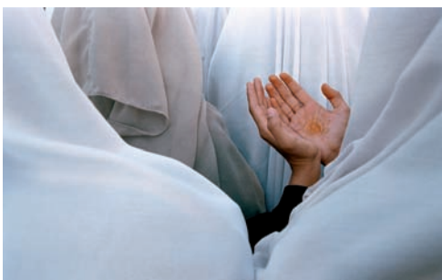
5. Réfugiés afghanes à Quetta, au Pakistan, priant pour les victimes des bombardements américains en Afghanistan. Septembre 2001.