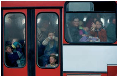
Photographie de l'affiche de l'exposition : Transport de kosovars vers un camp de réfugiés. Macédoine, avril 1999. © Photo Alexandra Boulat / Association Pierre & Alexandra Boulat