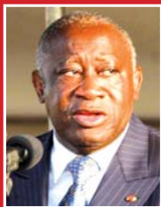
Sous le Haut Patronage du Chef de l'Etat, SEM Laurent Gbagbo