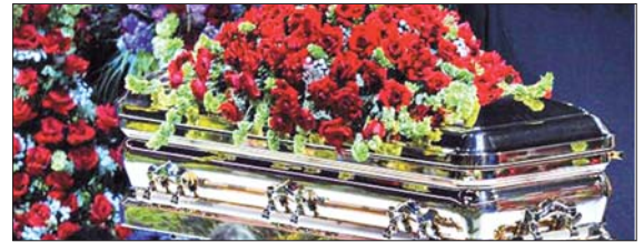
Une vue du cercueil de Michael Jackson.

à la famille et aux amis proches, aura lieu ce jeudi soir à 19 heures (04 heures du matin en France). Tout le quartier entourant le cimetière sera bouclé, et la police de Los Angeles a appelé les fans de Michael Jackson à rester chez eux. Les médias ne pourront franchir les grilles du cimetière, et un important service de sécurité est prévu pour faire respecter ces consignes. La police, appuyée par des hélicoptères et des chiens, compte