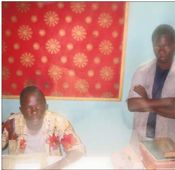
Des jeunes déscolarisés sans aucun niveau sont les médecins à Vavoua

Des propos qui s'avèrent être un véritable canular à la lumière des confidences de certains des ex-patients de ces cliniques, aujourd'hui marqués à vie après un traitement dans les "boîtes à injections". Mais aussi et surtout de professionnels de la santé exerçant à l'hôpital de Vavoua ainsi que dans les centres de santé communautaires de la région. « Ils se limitent pas qu'au paludisme, à la fatigue et autres comme ils le prétendent. Ils font les CPN, les accouchements, les avortements, les extractions dentaires, traitent les fibromes et les crises herniaires. Nous recevons