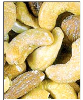
La noix de cajou, une ressource à préserver.

Les travaux du 2ème jour de l'ACA (African Cashew Alliance) ou (Alliance Africaine du Cajou) ont livré leur résultat, le 2 septembre 2009 à l'hôtel Ivotel, Plateau.