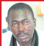
Sous l'Egide du Ministre de la Communication, Ibrahim Sy Savané