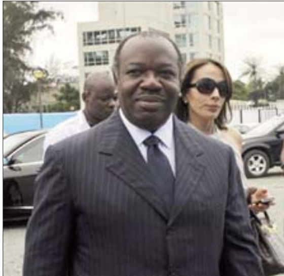
Ali Bongo accompagné de sa femme, Silvia, à Libreville, le 31 août 2009.

Je pense que chacun doit être mis devant ses responsabilités. En homme d'Etat, chacun doit mesurer toutes les paroles et tous les actes