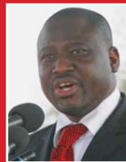
Sous le Haut Parrainage du Premier Ministre, SEM Guillaume Soro