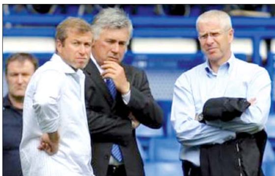
Roman Abramovich ne pourra pas offrir de nouveaux joueurs à Carlo Ancelotti pendant de longs mois