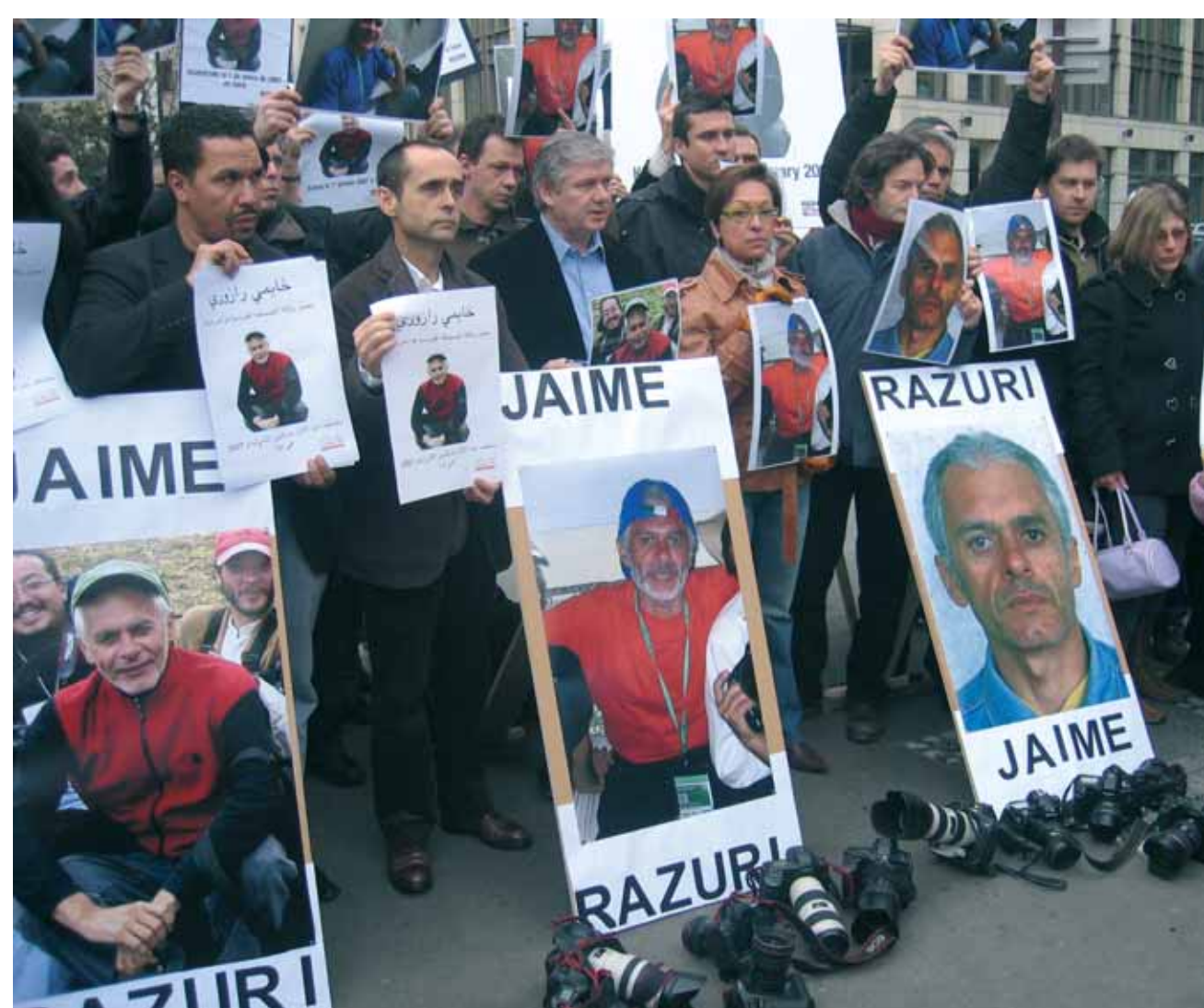
REPORTERS SANS FRONTIÈRES

Journaliste et militante des droits de l'homme, Anna Politkovskaia a été assassinée devant chez elle, le 7 octobre 2006, à Moscou. Une équipe de 150 enquêteurs a été mise en place par le Kremlin. La rédaction de Novaïa Gazeta mène de son côté ses propres investigations. A ce jour, aucun résultat n'a filtré. La mobilisation doit se poursuivre si l'on veut savoir qui se cache derrière cet assassinat.