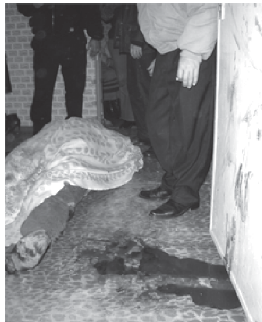
Sur les lieux du crime

L'année 2005 constitue également un tournant pour l'Azerbaïdjan sur le plan économique avec l'inauguration, le 25 mai, d'un oléoduc reliant Bakou, Tbilissi (Géorgie) et Ceyhan (Turquie). La mise en exploitation est prévue en octobre-novembre. Cet oléoduc devrait offrir à l'Etat un