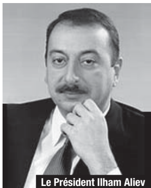
Le Président Ilham Aliev

Force est de constater que cet assassinat est un événement particulièrement mal venu pour le chef de l'Etat, à l'approche d'une échéance électorale cruciale pour le pays. « A qui profite le crime ? » Telle est en substance la question