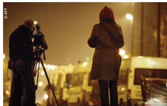
Periodistas franceses durante las revueltas en Villiers-le-Bel, en noviembre de 2007