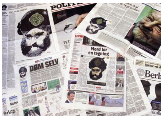
La caricatura del turbante fue la que generó más reacciones

En total, cerca de 150 periódicos publicaron esas caricaturas en medio centenar de países; bien para denunciarlas, bien para apoyar la libertad de prensa. Después de publicarlas, algunos fueron denunciados ante la justicia. En Europa no se ha condenado a ningún órgano de prensa por publicar las caricaturas.