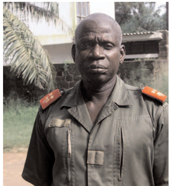
Batista Tagm na Wai