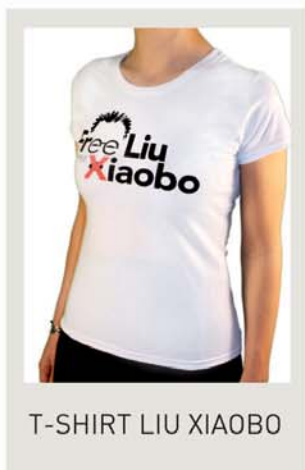
T-SHIRT LIU XIAOBO

Retrouvez en un clic tous nos albums, nos T-shirts et accessoires photo. L'argent récolté grâce à la vente de ces produits nous permet de mener nos actions en faveur de la liberté de la presse.