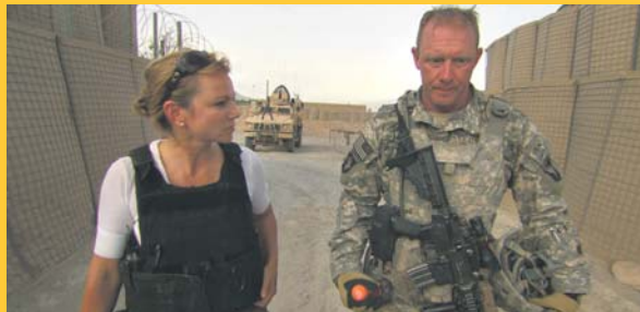
Lara Logan sur le terrain en Irak

Le 11 février dernier, Lara Logan et son équipe sont dans les rues du Caire et préparent un sujet pour le journal télévisé de CBS. Elles sont violemment prises à partie par une foule survoltée. La jeune reporter est séparée de son équipe et de son garde du corps par un groupe d'hommes, qui entreprennent d'arracher ses vêtements. Pendant près d'une demi-heure, elle subit violences et attouchements par plusieurs dizaines de personnes "Je n'ai même pas senti qu'ils me frappaient, la seule chose à laquelle je pouvais penser était leurs mains qui me violaient, encore et encore", a-t-elle raconté dans son témoignage sur CBS. "J'ai vraiment cru que j'allais y rester". Elle arrive finalement à proximité d'un groupe de femmes voilées qui se portent à son secours, la protègent, appellent à la rescousse des militaires qui la mettent en sécurité.