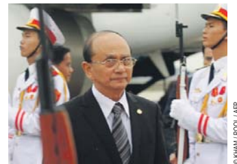
Thein Sein : un prédateur en remplace un autre

sans frontières au titre du projet qui lie l'organisation à l'Instrument européen pour la démocratie et les droits de l'homme (IEDDH).