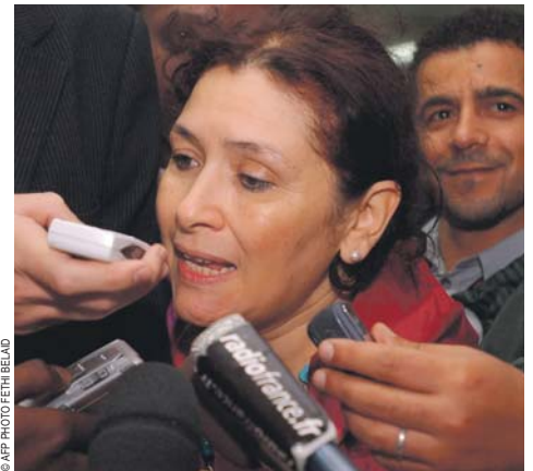
Sihem Bensedrine, journaliste et éditrice tunisienne, a été et reste à la pointe du combat pour les libertés.

Après avoir consulté un médecin égyptien, elle est rapatriée aux États-Unis avec son équipe. Elle passe quatre jours à l'hôpital : ses muscles, ses ligaments et ses tendons sont abîmés, et elle souffre de contusions multiples ainsi que de blessures intimes. Elle a cependant repris son travail très rapidement, refusant de se laisser abattre par son agression.