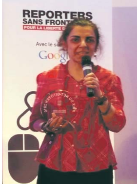
La cyberféministe iranienne Parvin Ardalan première lauréate du prix RSF du Net-citoyen, le 11 mars 2010.

En 2010 encore, nous avons inauguré le premier abri anti-censure dans le monde. Ce lieu offre des solutions de navigation sur Internet et de communications électroniques totalement sécurisées. En 2011, nous allons encore étendre ce travail grâce à la mise en place d'un Observatoire du web qui sera chargé de répertorier toutes les atteintes à la liberté de circulation de l'information en ligne, mais aussi de défendre la neutralité du Net et de promouvoir la responsabilité des entreprises qui travaillent dans des pays répressifs. Nous lancerons aussi le premier site dédié à l'hébergement de contenus censurés. Une sorte de WikiLeaks de la censure.