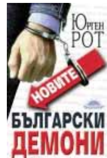
Couverture du livre de Jurgen Roth

Le syndicat officiel, l'Union des journalistes bulgares (UJB), a établi un code de déontologie et des chartes professionnelles, bénéficiant du support des structures internationales. Mais son application est quasi inexistante. L'UJB n'a que très peu de crédibilité au sein de la profession. Elle revendique 4 500 membres cotisants. Mais ses principales ressources financières sont issues de complexes hôteliers sur la mer Noire et en montagne, hérités des anciennes structures communistes. Elle édite également un hebdomadaire Pogled ( Le Regard ) qui ne jouit pas d'une grande diffusion.