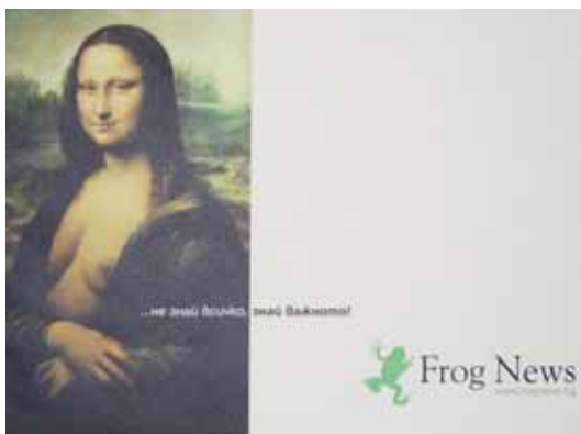
Fresque dans le hall de la rédaction de Frognews